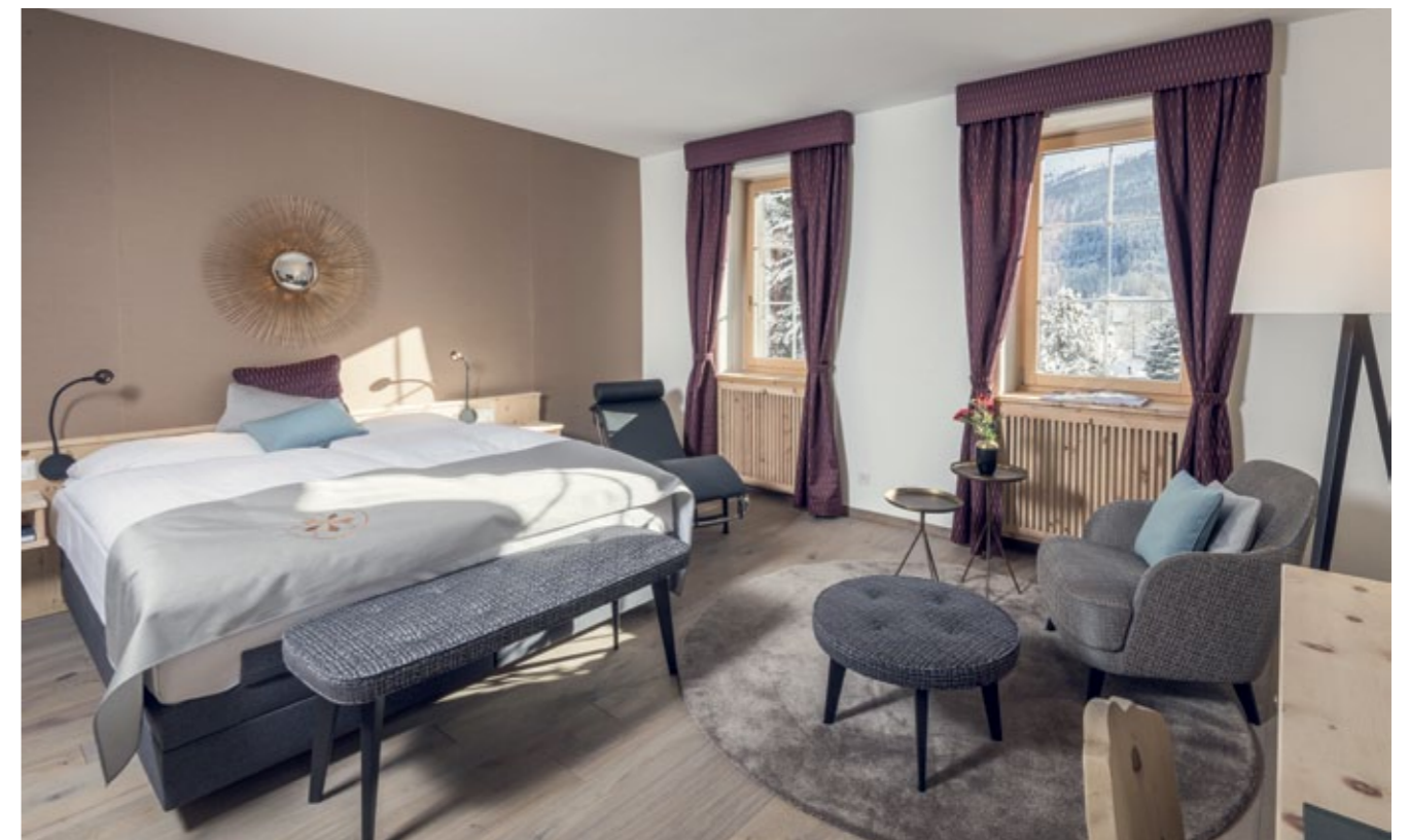
In den Zimmern und Suiten, bei denen keines dem anderen gleicht, trifft Engadiner Handwerkskunst auf Design.