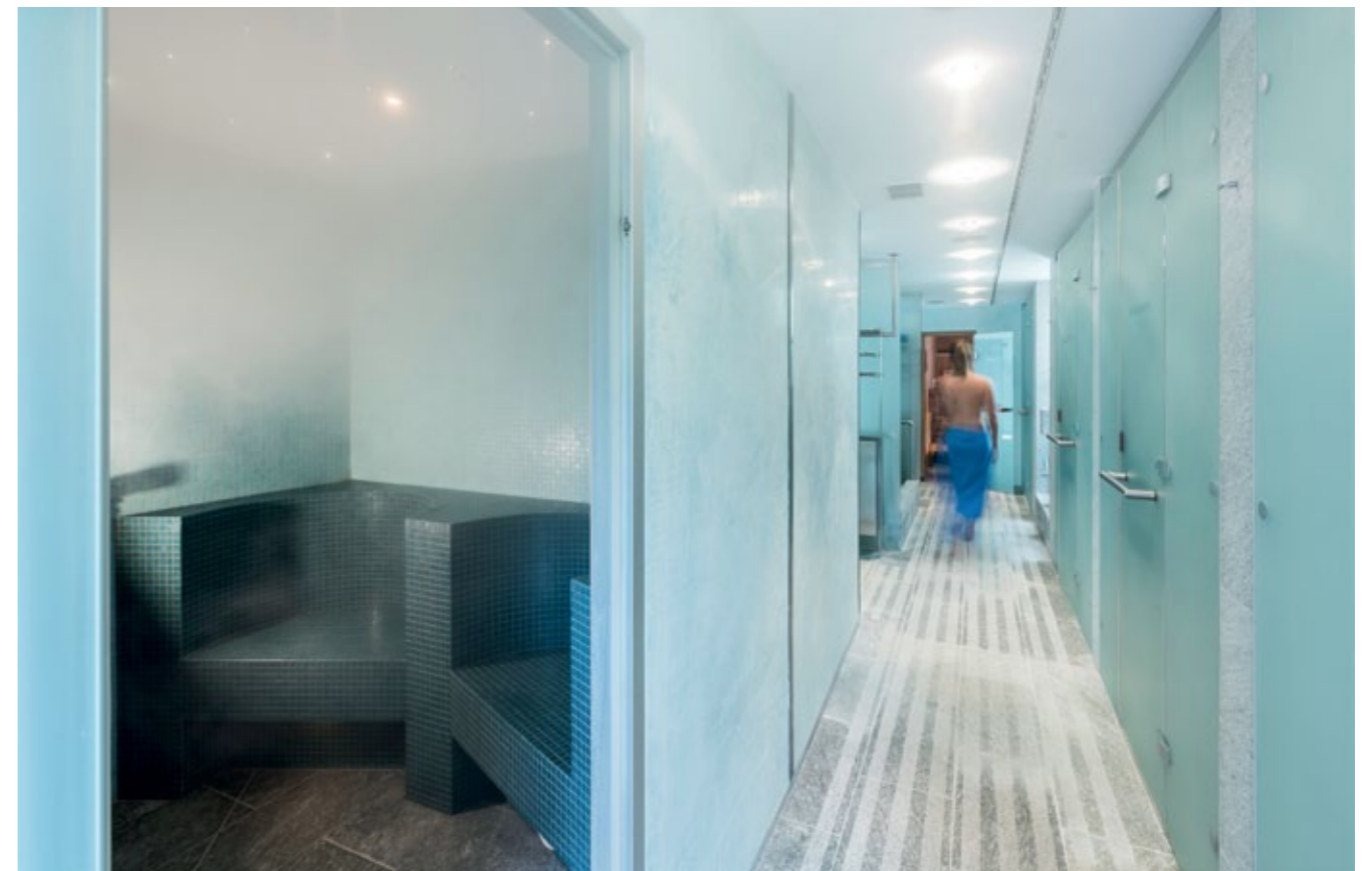
Das Spa „la Funtauna“ ist ein Kraftort. Neben verschiedenen Massagen tragen Whirlpool, Sanarium, Dampfbad mit Aromatherapie, die Kneippzone und vieles mehr zur Regeneration bei.