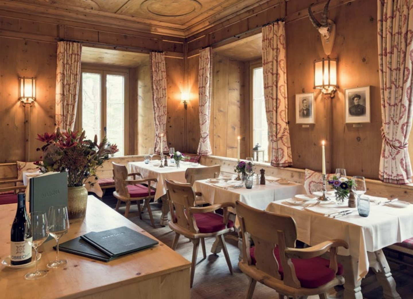
Der Hauch der Geschichte ist im ganzen Haus spürbar. So auch in der nach Arven duftenden Stüva 1817, in der Bündner und Veltliner Spezialitäten serviert werden.