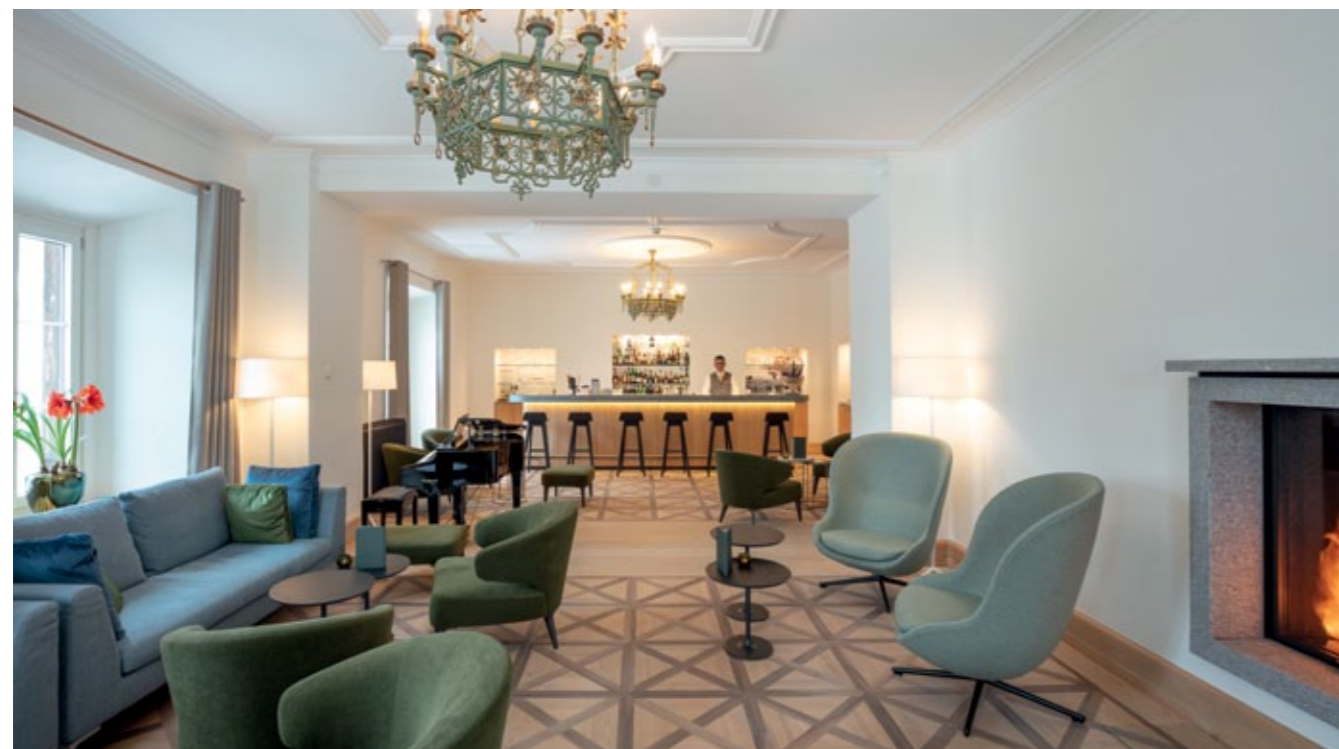
Die Hotelbar mit Cheminée ist das Herzstück des Parkhotels Margna. Bequeme Lounge-Möbel und frische Farben harmonieren perfekt mit dem beeindruckenden Parkettboden, den historischen Kronleuchtern und den grossen Fenstern.