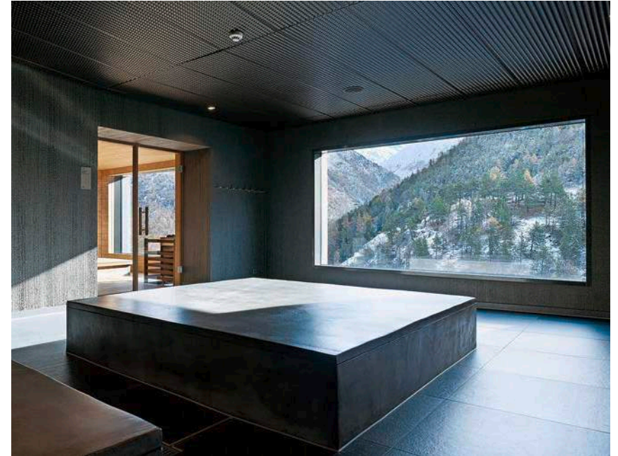
Wer findet den Unterschied? Wellnessoase und Zimmer in der Jugendherberge (oben); Hallenbad im luxuriösen Walliserhof (unten).

Nur gerade 200 Meter vom Wellness Hostel 4000 entfernt in Richtung Dorfmitte thront der Walliserhof, zusammen mit dem Capra das einzige Fünfsternehotel in Saas-Fee. Bereits die gepflegte Chalet-Fassade und der Aussenbereich um den Haupteingang signalisieren, dass sich hier ein Hotel des oberen Preissegments befindet.