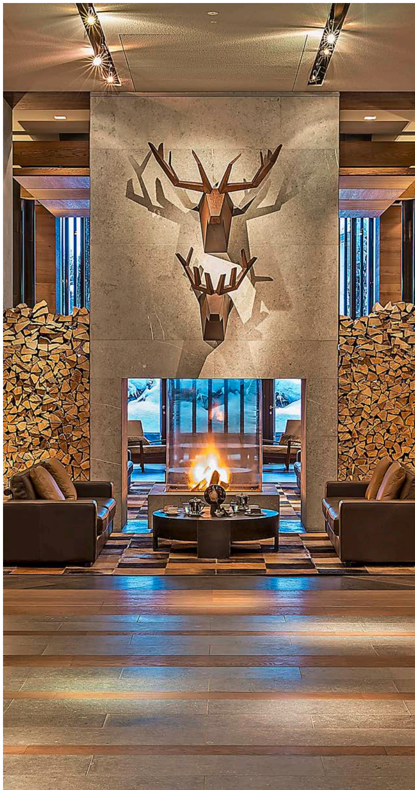
Erneut zum besten Ferienhotel mit fünf Sternen erkürt: The Chedi Andermatt.

In der Kategorie der besten Winterhotels mit vier Sternen steht erstmals das Walther in Pontresina ganz oben. Das von der Besitzerfamilie brillant geführte Schlösschen war noch nie so gut; bezeichnenderweise gehört es auch zu den am besten ausgelasteten Hotels im Land. Bereits auf Platz drei schaffte es das Bergwelt in Grindelwald, ein Design-Hotel, das