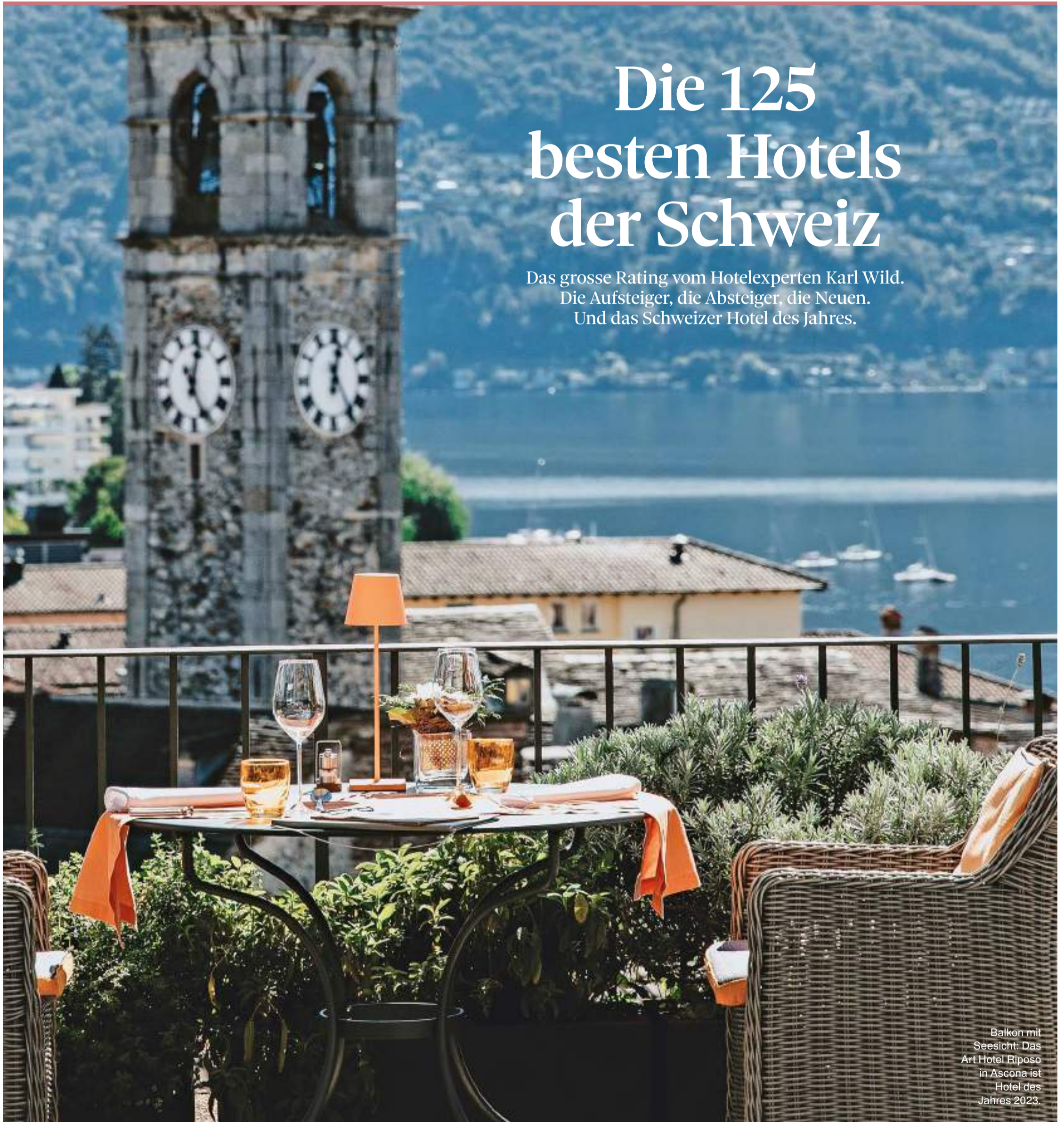
Balkon mit Seesicht: Das Art Hotel Riposo in Ascona ist Hotel des Jahres 2023.

Das grosse Rating vom Hotelexperten Karl Wild. Die Aufsteiger, die Absteiger, die Neuen. Und das Schweizer Hotel des Jahres.