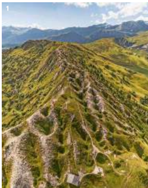
Wie aus einer anderen Welt: Im Gebiet Gryden sind die Hänge mit Kratern und Trichtern übersät.

Fünf Top-Wanderungen Eine spektakuläre Szenerie, geologische Raritäten und viel Wasser – das sind die Zutaten für aussergewöhnliche Naturerlebnisse in und um Lenk im Simmental.