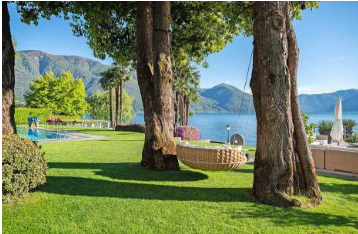
Traumresort am Lago Maggiore: Das Eden Roc in Ascona ist das beste Ferienhotel der Schweiz.

In den vier weiteren Kategorien gab es an den Spitzenpositionen nichts zu rütteln. Der Vitznauerhof ist erneut die Nummer eins unter den besten Nice-Price-Ferienhotels. Bei