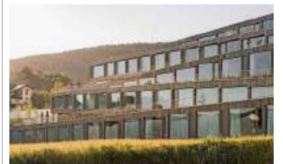
Hôtel des Horlogers: Erstes Schweizer Ökohotel.