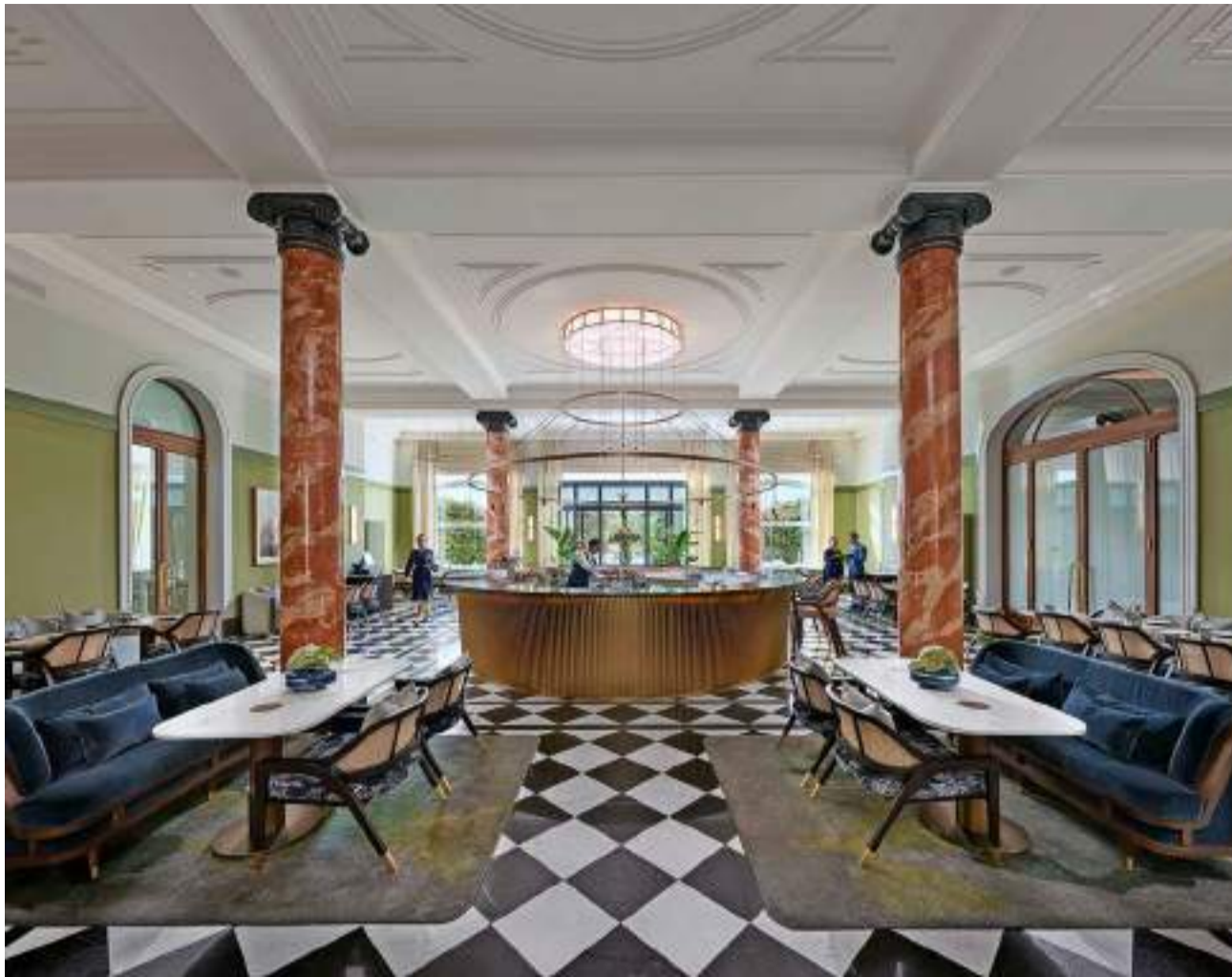
Treffpunkt für Einheimische und Gäste: Die «MOzern Bar & Brasserie» im neueröffneten Mandarin Oriental Palace in Luzern.

68 Zimmer und eine Suite beherbergt das Hermitage. Im ersten und zweiten Stockwerk finden sich gleich zwanzig weitere Stars – die von Herzog & de Meuron gestalteten «Lake Design Balcony»-Zimmer. Hier fühlt man sich gleich umarmt und zuhause, dank dem gemütlichen Eingangsbereich. Je weiter man vordringt, umso luftiger, leichter und heller wird es, bevor man schliesslich beim Bett vor dem Balkon landet. Ute Dirks und ihre neunzigköpfige Crew werden noch weitere Sterne vom Himmel holen: Das Hermitage kriegt eine Wellnesszone mit Infinity-Whirlpool und Sauna am See.