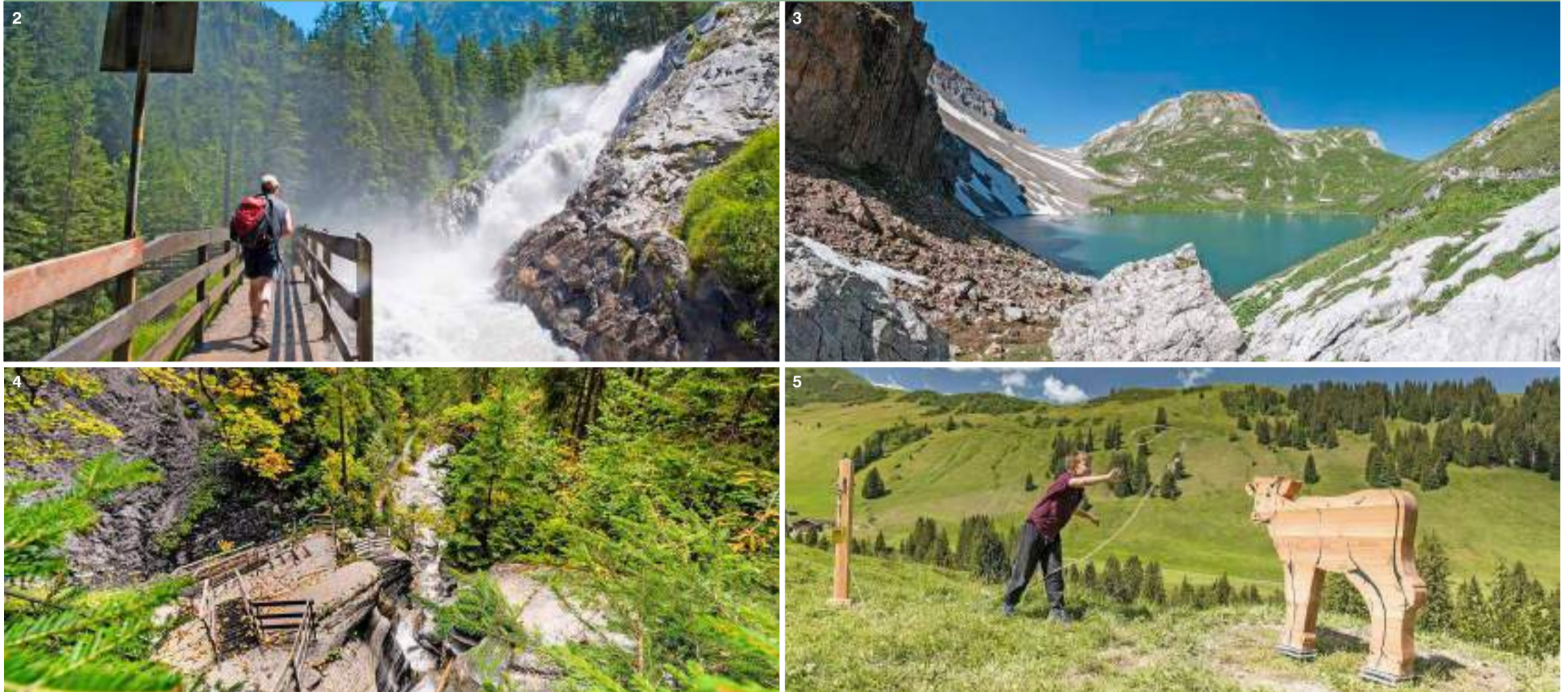
Faszinierende Ausflugsziele in der Region Lenk im Simmental: Die «sibe Brünne» auf dem Rezliberg (2); der kristallklare Iffigsee (3); die schroffe Wallbachschlucht (4) und der unterhaltsame Jodlerweg (5).