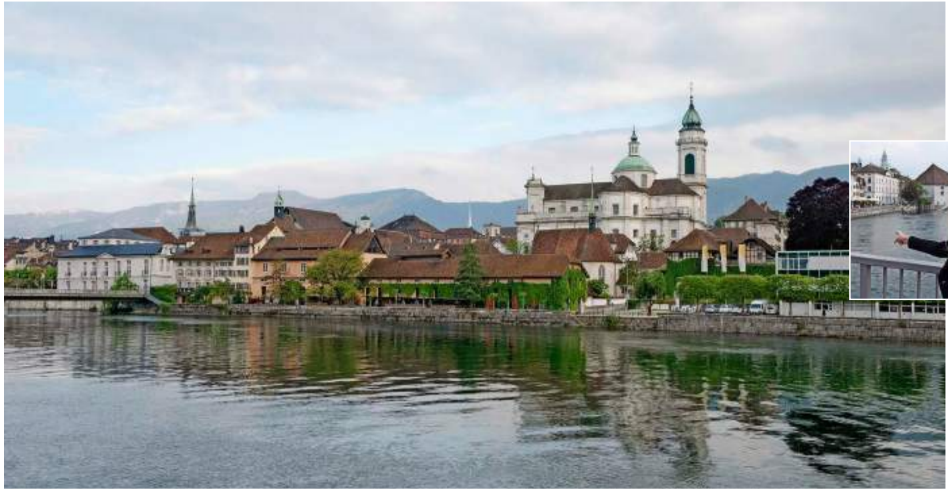
Sightseeing: Claudia Sollberger führt die Touristen durch das 2000 Jahre alte Solothurn.