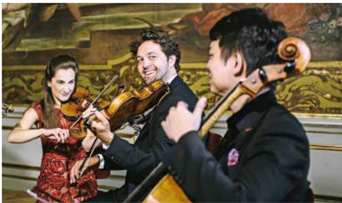
Geschichte und Kultur: Die mittelalterliche, über tausendjährige Stadt Bautzen in der Region Oberlausitz; und das zu den international bedeutendsten Kammermusik-Anlässen zählende Moritzburg-Festival.