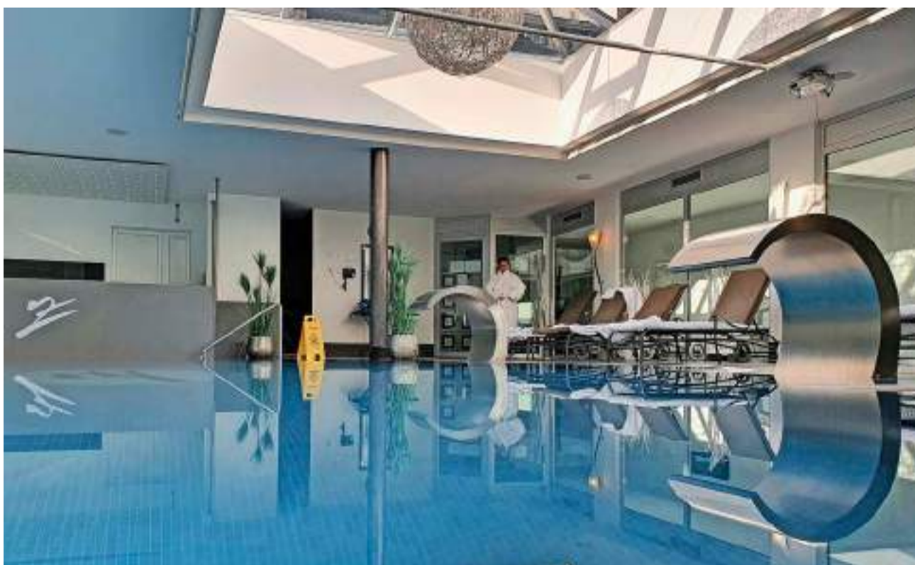
Tausend Quadratmeter grosser Wellnessbereich mit Schwimmbad: Das Hotel & Spa Pirmin Zurbriggen in Saas Almagell VS.