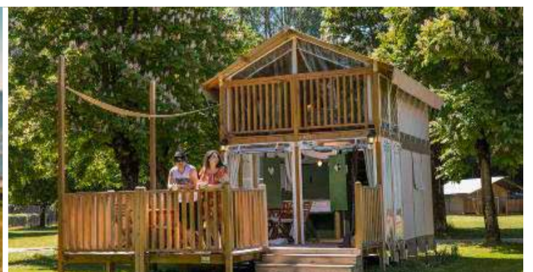
Die TCS-Campingplätze bieten unkomplizierte Ferien inmitten der Natur: Komfortables Mobilehome in Lugano-Muzzano; Pop-up-Glamping oberhalb von Laax GR; Air Lodge mit einem Zelt auf zwei Etagen in Sion VS.

Während der Corona-Pandemie konnten sich die Schweizer Campingplätze vor Anfragen nicht mehr retten. Ist wieder ein wenig Ruhe eingekehrt?