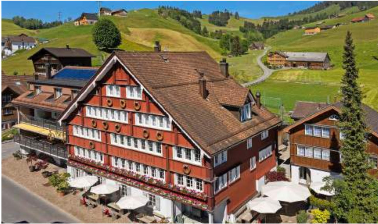
Haus mit 400-jähriger Geschichte: Das traditionsreiche Boutique-Hotel Bären in Gonten AI.

Eine Zusammenarbeit mit dem Appenzeller Huus.