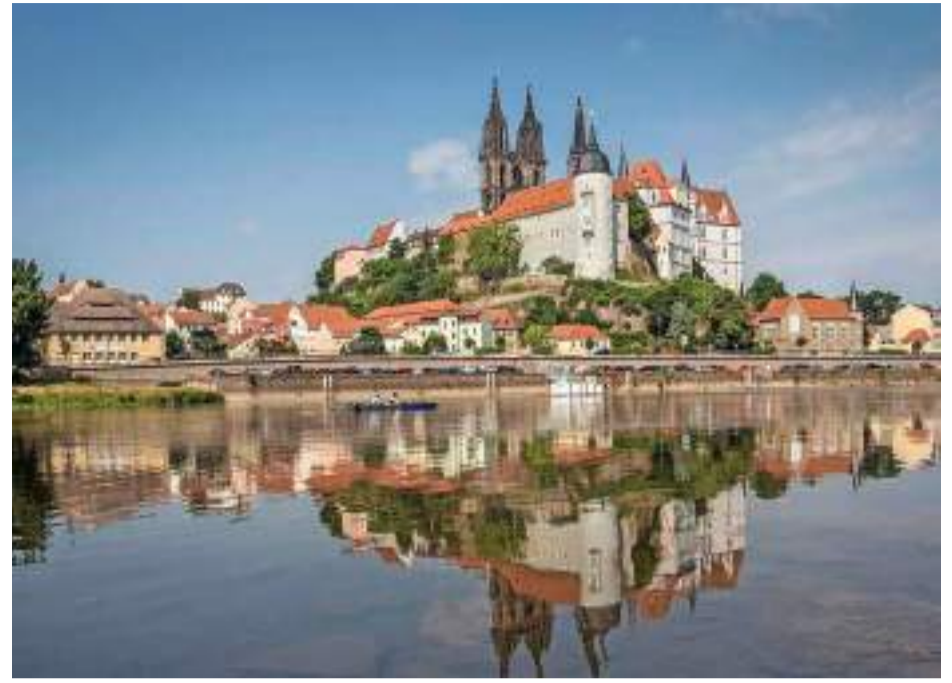
Architektonische Meisterwerke und touristische Sehenswürdigkeiten in Sachsen: Die 500 Meter lange Brühlische Terrasse in Dresden und die mittelalterliche Albrechtsburg in Meissen. Fotos: J. Gutzeit, S. Rose