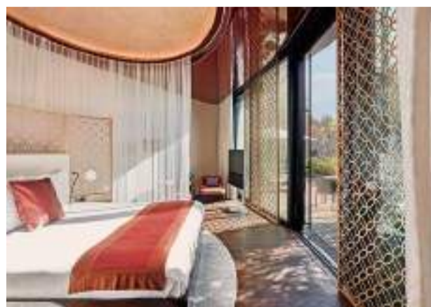
Atemberaubend: The Dolder Grand

11. (neu) Mandarin Oriental Palace*****(S) 6002 Luzern Telefon 041 588 18 88 www.mandarinoriental.com Gastgeber: Ch. Wildhaber DZ/F ab 620 Fr.