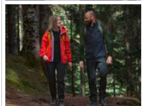
Nachhaltig: Rotauf produziert seine Textilien nur in der Schweiz und ohne schädliche Chemikalien.