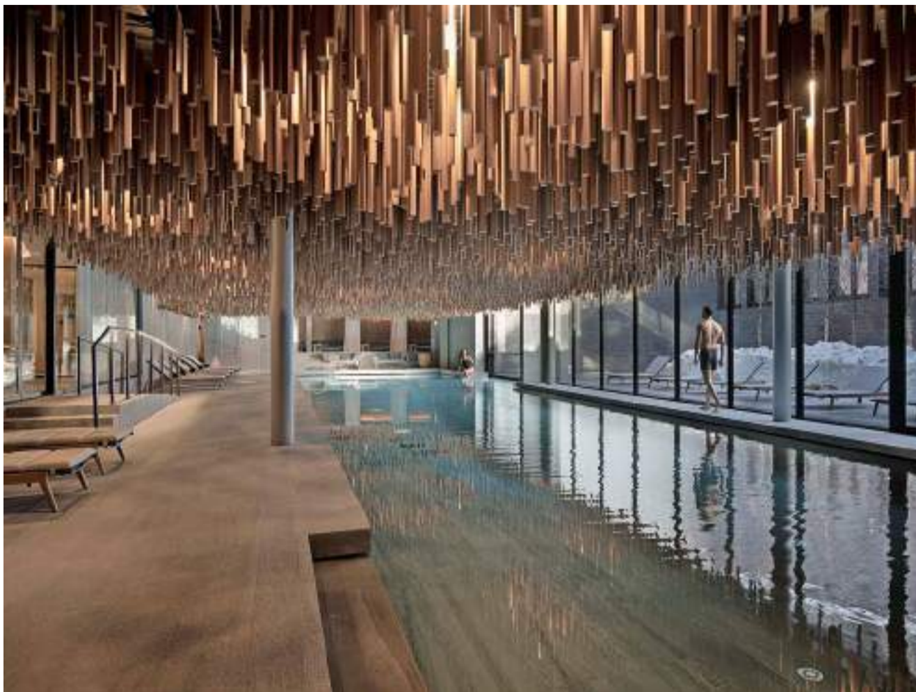
Herzstück im Six Senses ins Crans-Montana: Die 2200 Quadratmeter grosse Wellnesszone.

Das umweltschonende Konzept wird in diesem Hotel bis ins Detail gelebt. Doch der grosse Haken daran bleibt: Um mit gutem Gewissen zu geniessen, jettet die Mehrheit der Hippies of Luxury Tausende Kilometer weit.