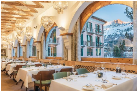
Restorant dal Parc