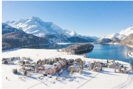
Parkhotel Margna im Winter