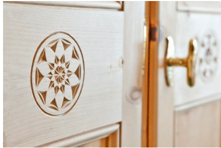
Arvenholzdetails im ganzen Haus