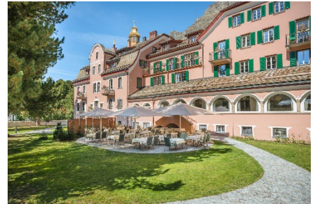
Hotelgarten mit Terrasse