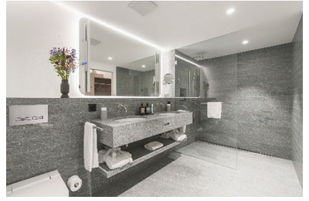
Badezimmer mit einheimischem Granit