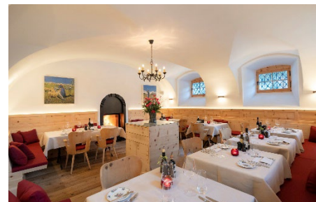
Enoteca & Osteria Murütsch