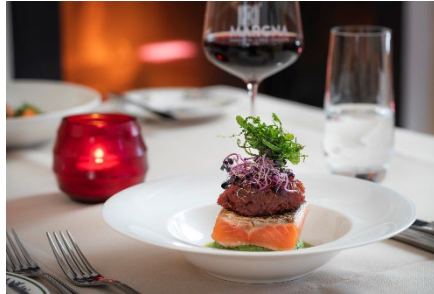
Kulinarik im Parkhotel Margna