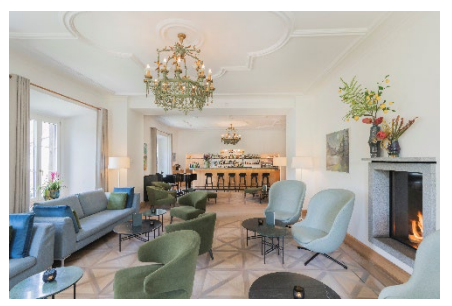
Hotelbar mit Cheminéefeuer