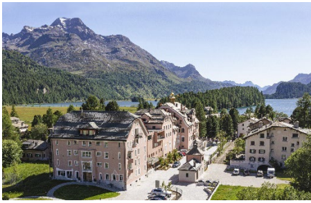
Parkhotel Margna im Sommer