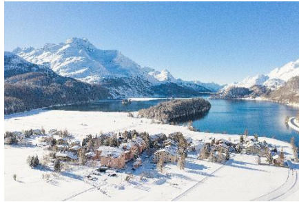
Parkhotel Margna im Winter