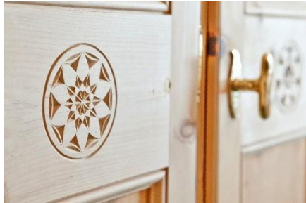
Arvenholzdetails im ganzen Haus