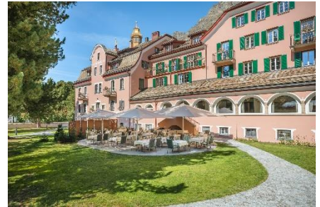
Hotelgarten mit Terrasse