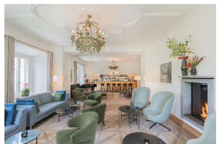
Hotelbar mit Cheminéefeuer