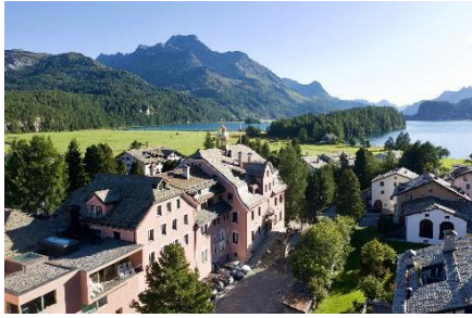
Parkhotel Margna im Sommer