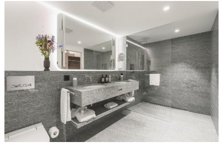
Badezimmer mit einheimischem Granit