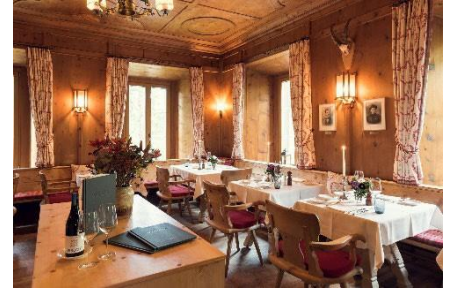
Restaurant Stüva 1817