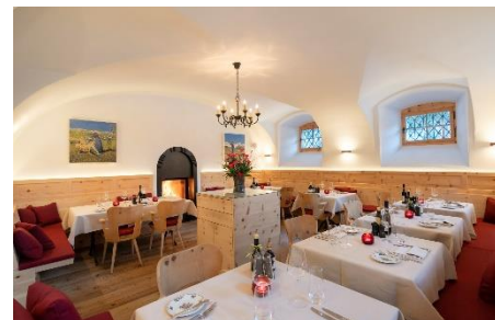
Enoteca & Osteria Murütsch