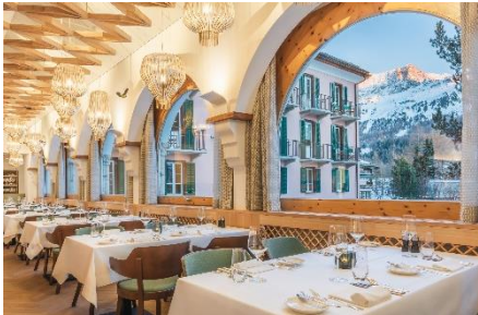
Restorant dal Parc