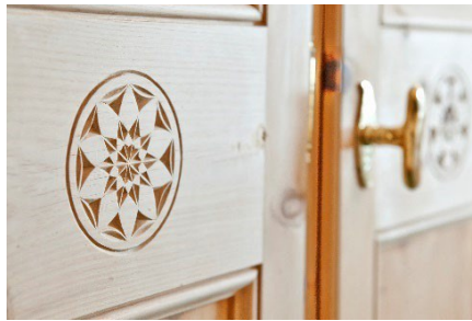
Arvenholzdetails im ganzen Haus