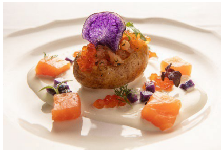
Gourmet-Karussell, Abendmenü in den drei Restaurants