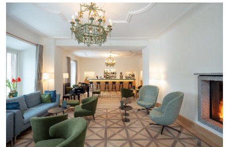
Hotelbar mit Cheminéefeuer