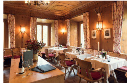
Restaurant Stüva 1817