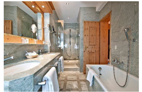
Badezimmer mit einheimischem Granit