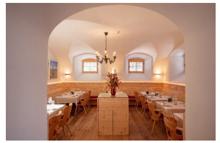
Enoteca & Osteria Murütsch