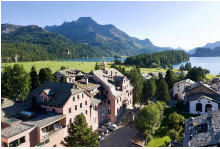
Parkhotel Margna im Sommer