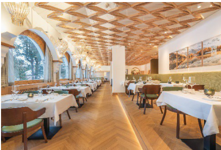
Restorant dal Parc