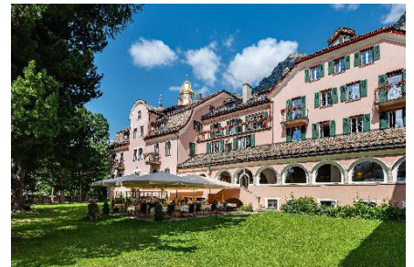
Hotelgarten mit Terrasse