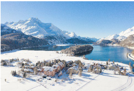
Parkhotel Margna am Silsersee