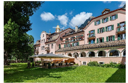
Hotelgarten mit Terrasse