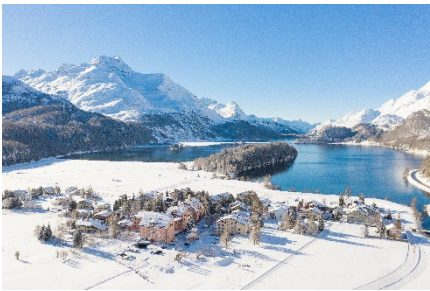
Parkhotel Margna am Silsersee