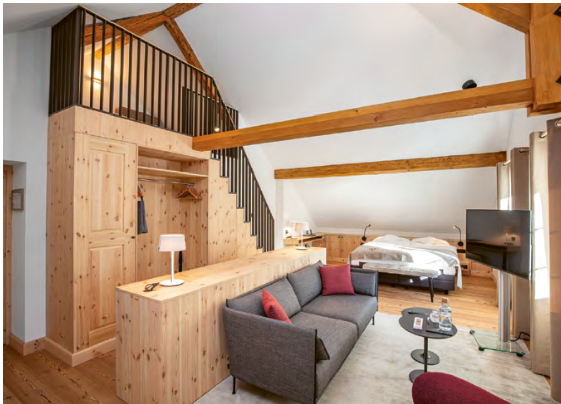
Suite Furtschellas | 40 m 2 | mit Galerie | bis zu 4 Personen | gemütliche Atmosphäre mit Dachbalken | direkte Sicht auf die Berglandschaft Furtschellas